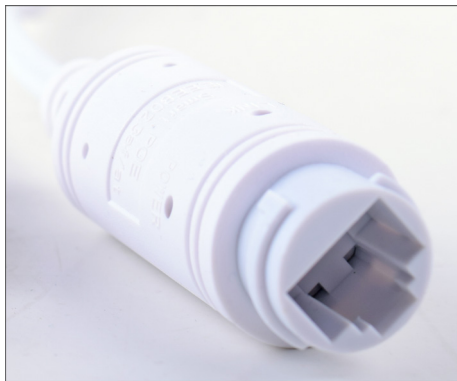
Netzwerk / POE