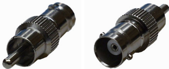
Artikel Nr.: 20900

Dieser Adapter ermöglicht den Übergang von einem BNC-Stecker auf eine Chinch-Buchse.