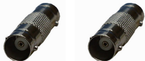
Artikel Nr.: 20647

Dieser Adapter ermöglicht die Verbindung von zwei Kabeln mit BNC-Stecker.