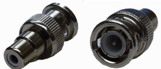
Artikel Nr.: 20901

Dieser Adapter ermöglicht den Übergang von einer BNC-Buchse auf einen Chinch-Stecker.