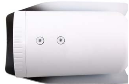
Zoom- und Focuseinstellung